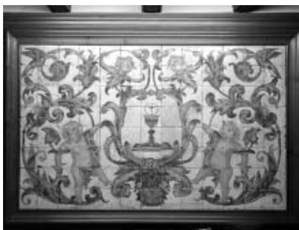
Figura 2. Imagen del estado actual de uno de los paneles localizados en la Sacristía de la iglesia de Santa María