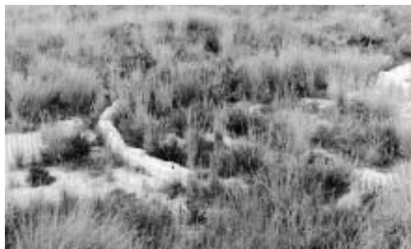
Figs. 5-7. Situación del pavimento de mosaico hallado en la villa de los Baños de la Reina de Calpe (Alicante). Fotografías tomadas tras la intervención de 1997, en 2001 y en 2003.

mento paralizado. Mientras, los mosaicos siguen a la intemperie, deteriorándose día a día y luchando desesperadamente por su conservación (figs. 5-7).