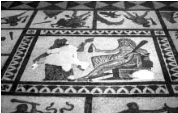
Fig. 2. Mosaico de los trabajos de Hércules hallado en Liria (Valencia) y conservado en el Museo Arqueológico Nacional.

descubrir pequeños fragmentos y un pavimento opus tessellatum , el famoso mosaico de los trabajos de Hércules, actualmente conservado y expuesto en el Museo Arqueológico Nacional (fig. 2). Junto a esta pieza, sólo podemos contabilizar en la provincia algunos casos más de mosaicos que actualmente se exhiben en un museo: el pavimento de las nueve Musas de Moncada 2 , el de la Medusa de la propia ciudad de Valencia (fig. 3), y el tessellatum descubierto hace pocos años en la villa de Font de Mussa (Benifayó).