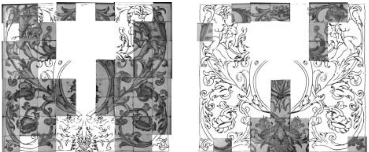
Figura 9. Reorganización virtual de los paneles correspondientes al segundo diseño o con las piezas que se conservan en la actualidad