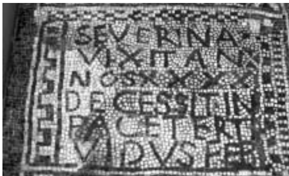
Fig. 8. Lauda sepulcral de Severina hallada en Denia en 1878. Detalle de la inscripción. Museo de Bellas Artes San Pío V de Valencia.

Como hemos podido comprobar, volvemos a encontrarnos situaciones variopintas en cuanto a la conservación del patrimonio se refiere. Esperanza y satisfacción por algunos casos concretos, pero siempre con reservas, ya que quizás podemos darnos por satisfechos únicamente con el hecho de que las piezas se hayan “salvado” a pesar de que estén colgadas en una pared o colocadas en pesados soportes de cemento; dada la situación esto puede parecerse ya todo un éxito. Pero desesperación e impotencia en muchos otros casos; situaciones que ya vienen siendo habituales, como la destrucción o abandono de impresionantes conjuntos, que podemos considerar con mayor gravedad si tenemos en cuenta que hablamos en ocasiones de un problema actual no resuelto por motivos políticos o económicos. No nos cansaremos de repetirlo: como conservadores del patrimonio somos nosotros los primeros que debemos denunciar ciertas situaciones incomprensibles que, desgraciadamente y más a menudo de lo que desearíamos, se repiten una y otra vez en esta sociedad nuestra supuestamente “sensibilizada” en la salvaguarda de su legado arqueológico.