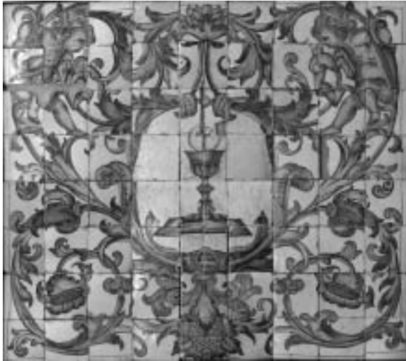
Figura 3. Composición actual del segundo panel de Santa María