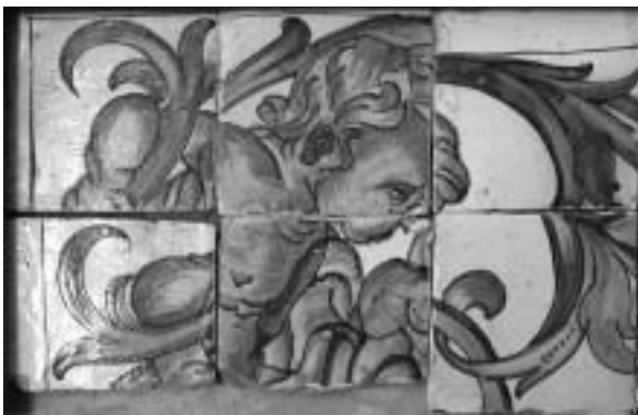
Figura 6. Detalle de la incorrecta disposición de algunos azulejos