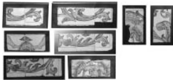
Figura 5. Grupo de azulejos dispersos en dependencias de Santa María