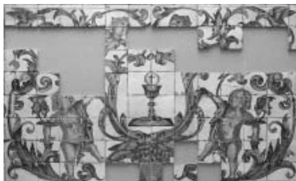
Figura 1. Panel cerámico en la iglesia de Sant Miquel