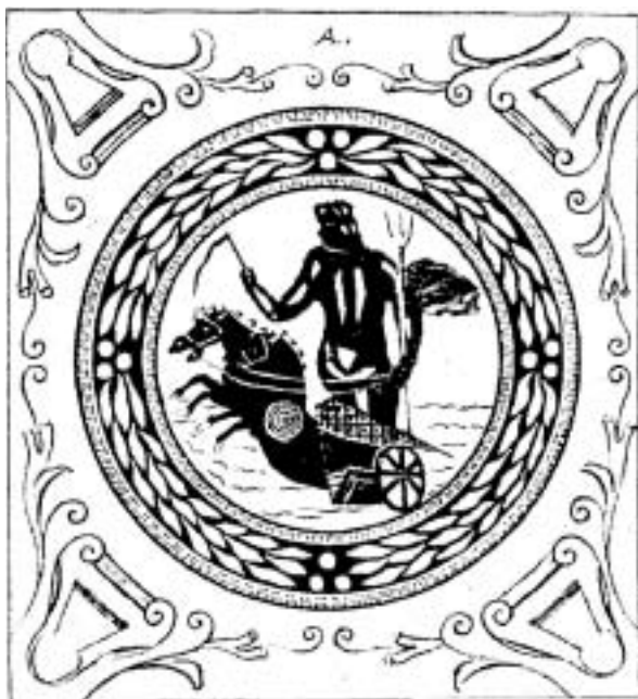
Fig. 4. Dibujo de un mosaico representando a Neptuno de la villa del Puig (LABORDE 1975: 265, dibujo nº 40).

do. Se trata a menudo de hallazgos antiguos que de forma casual se solían producir mientras se realizaba algún tipo de trabajo o transformación en campos agrícolas; la destrucción de piezas tan valiosas como los mosaicos por miedo a que se paralizasen las obras era una práctica demasiado generalizada, sobre todo en las primeras décadas del pasado siglo, cuando no existía una mentalización adecuada y la arqueología estaba todavía por desarrollarse de acuerdo a una metodología científica. Estos destrozos eran sin duda un claro signo de ignorancia e incluso de desprecio hacia nuestro propio patrimonio arqueológico y demuestran indudablemente una alarmante falta de concienciación social. Imaginamos que cierto número de piezas se perderían en el anonimato que supone la destrucción a causa del pico o la pala excavadora, de no existir esas personalidades relevantes, amantes de lo antiguo e interesados en dichos hallazgos que, a lo largo de los años, fueron preocupándose por su conservación. Aún así, es evidente que varios restos escaparían a los ojos de estos estudiosos y tuvieron igualmente fin dramático.