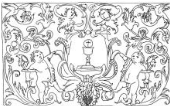
Figura 7. Detalle de la incorrecta disposición de algunos azulejos