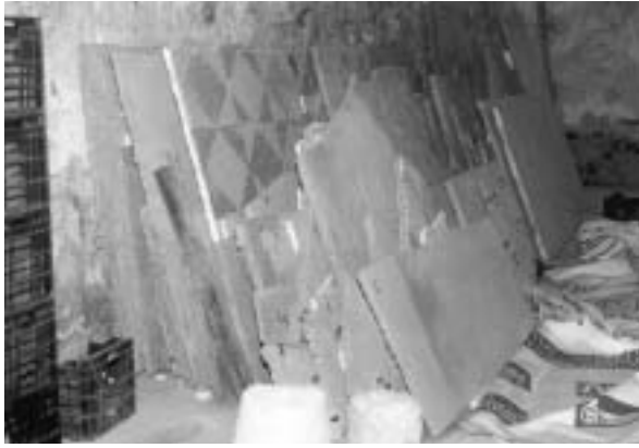
Fig. 1. Situación actual del mosaico del Castigo de Dirce (Sagunto, Valencia) almacenado en dependencias municipales y consolidado sobre soportes de cemento.

descubrir pequeños fragmentos y un pavimento opus tessellatum , el famoso mosaico de los trabajos de Hércules, actualmente conservado y expuesto en el Museo Arqueológico Nacional (fig. 2). Junto a esta pieza, sólo podemos contabilizar en la provincia algunos casos más de mosaicos que actualmente se exhiben en un museo: el pavimento de las nueve Musas de Moncada 2 , el de la Medusa de la propia ciudad de Valencia (fig. 3), y el tessellatum descubierto hace pocos años en la villa de Font de Mussa (Benifayó).