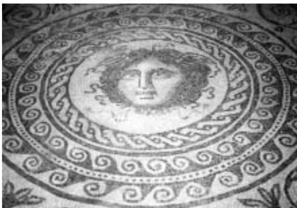
Fig. 3. Mosaico de la Medusa hallado en la c/ Reloj Viejo de Valencia. Museu d'Història de Valencia.